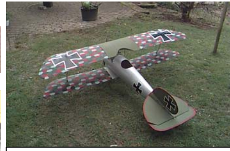
Serienmodell mit Tarnlackierung