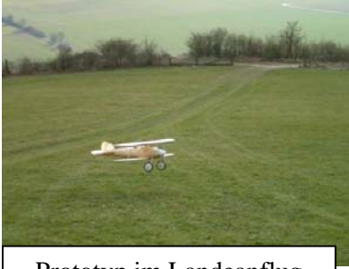
Prototyp im Landeanflug