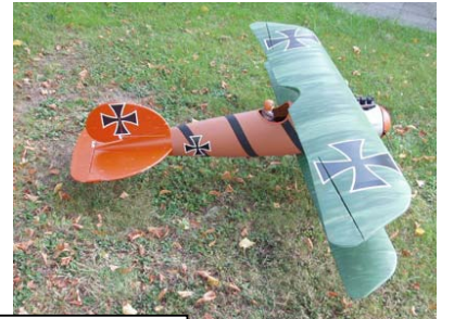
Beide Reihen: Kundenmodell mit OS 70 4-Takt Motor