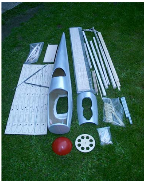
Bausatzinhalt, links Randbögen, Motorattrappe und Spinner