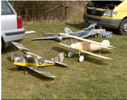
Albatros Prototyp + unsere Tiger Moth